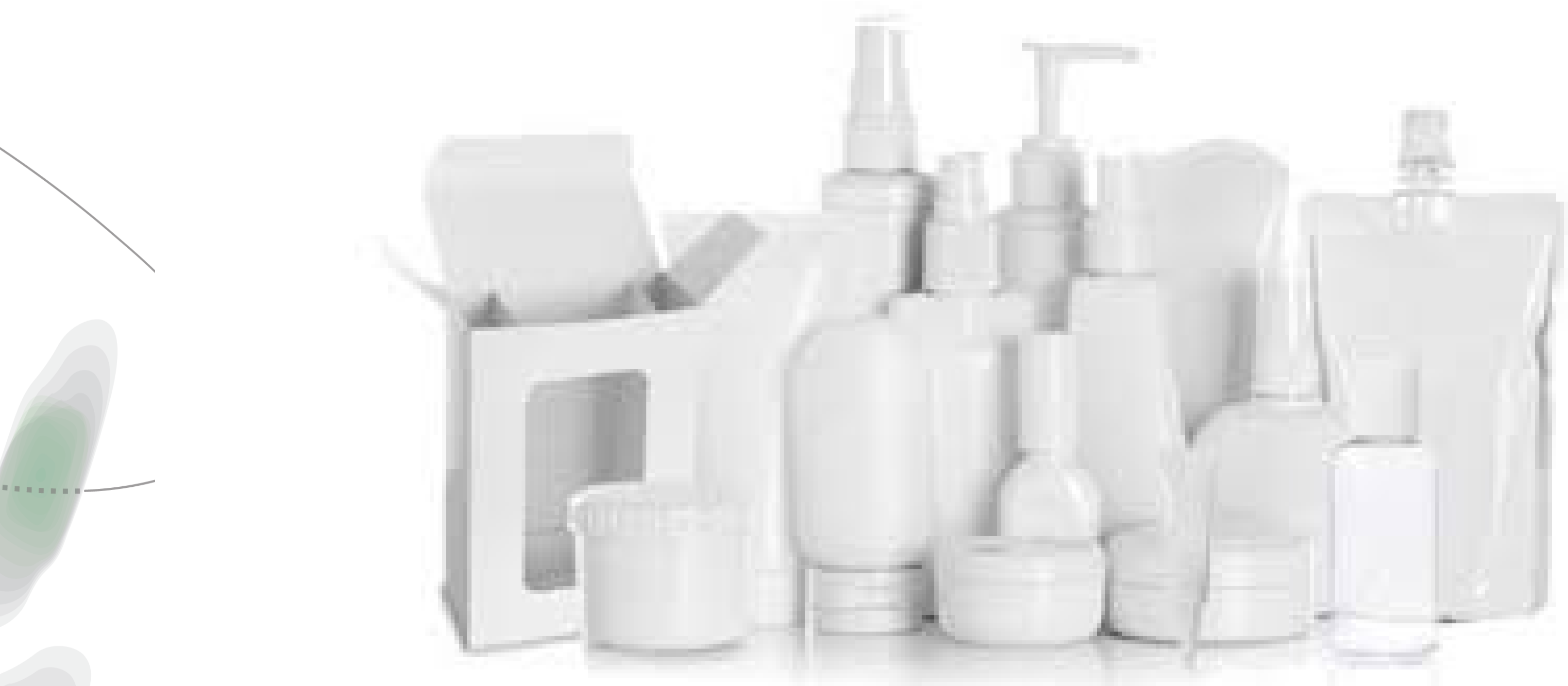
Figure 1: Figure title number one

coribus nus erum facea qui consererspispis unti dolorest, aut dolupta tiorrumqui odi andae porum facea quo cullestrum exceaue idelique et audae volorae. Sitatium aut audignam, omnimus et porior ratesere plant volorer sperae dent eaturis quam rate labor arum volentum aut inventi volenita dis debit, ut fuga. Et vellatem fugitiiscia ducitaquis et optatibus aut