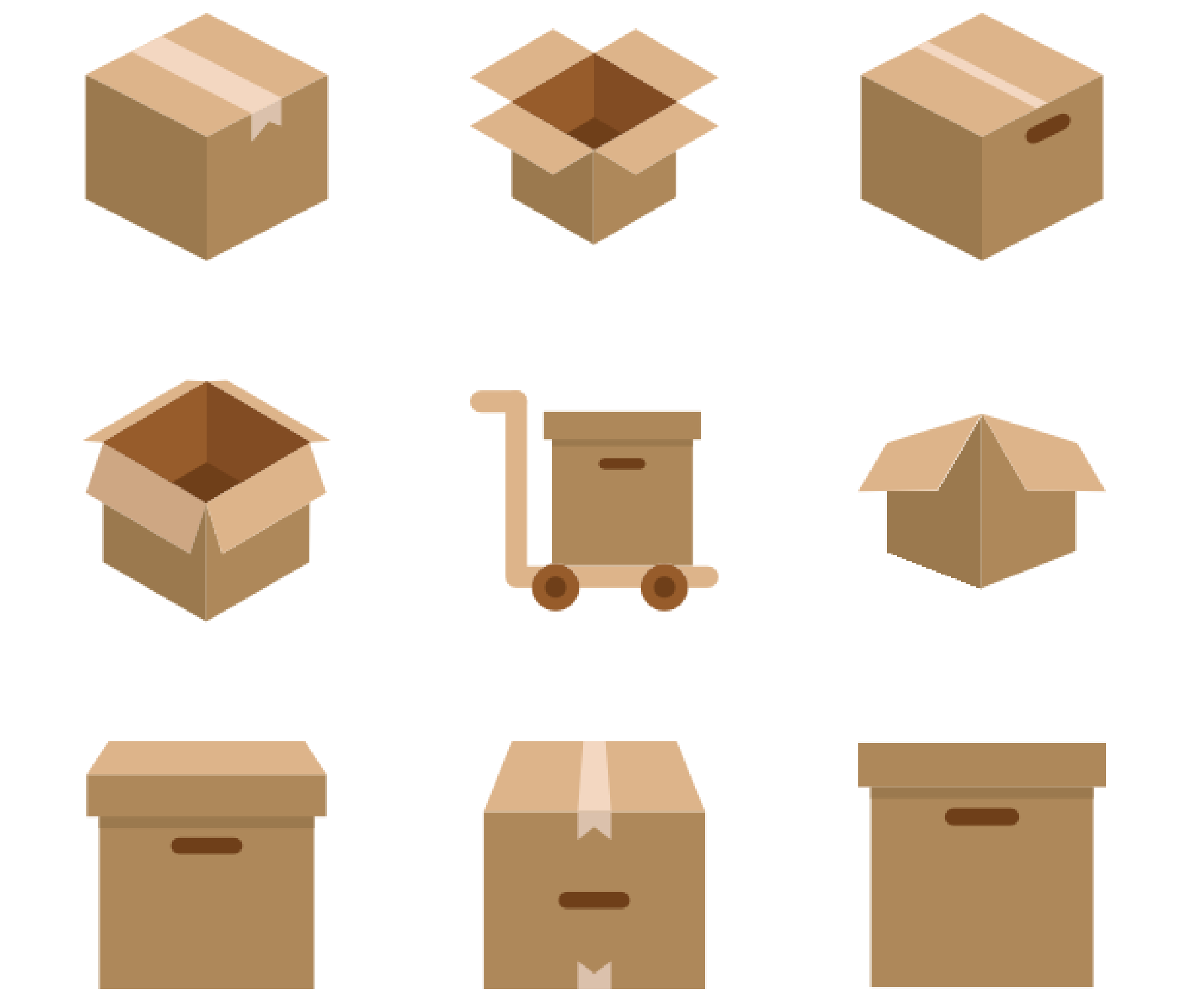
Figure 3: Figure title number three

Ti dis sinus eatem dolores doloris idessim in pe delendi gnation ent et omnihil luptust, occum, sapiet excepro experiatem fugit iume comnis quibust otaquam, quodist qui dolut et re, consect usciis rectio eturitis simus, sequas es veni cone am lam que aut ommodip samenis assit, qui ne voluptia di ommoluptius adita quibus et qui nos mint utatiatium unditium aut ut